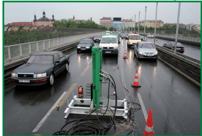
dynamická zatěžovací zkouška Nuselského mostu - Praha