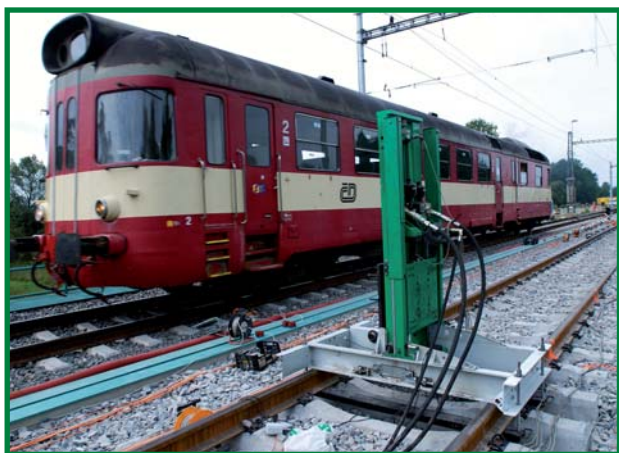
dynamická zatěžovací zkouška mostu