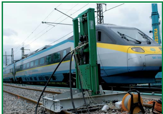
dynamická zatěžovací zkouška mostu Moravičany